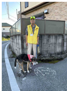
(中央) 活動時における愛犬用のバンダナ

南国市教育委員会では、子どもたちを犯罪や事故から守るため、学校・保護者・地域住民が連携してボランティア活動を推進しています。活動の一つとして、愛犬家の皆さんが、愛犬の散歩の時間やコースを子どもたちの登下校の時間帯や通学路に合わせ、愛犬と散歩をしながら登下校中の子どもたちの安全を見守っています。子どもたちは顔見知りの大人やかわいい犬と触れ合いながら、安心して通学できています。