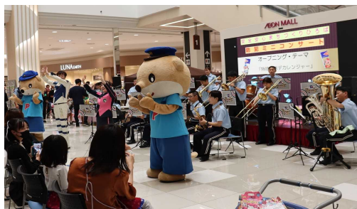
県警察音楽隊による防犯ミニコンサート