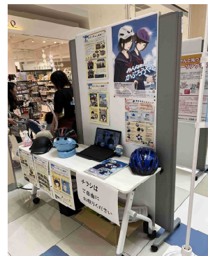
各種啓発パネルの展示