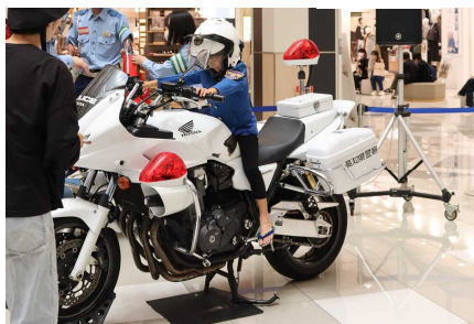
白バイの体験乗車